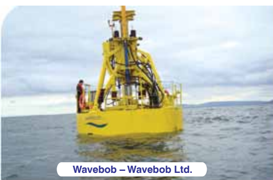
Wavebob – Wavebob Ltd.