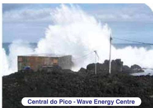
Central do Pico - Wave Energy Centre