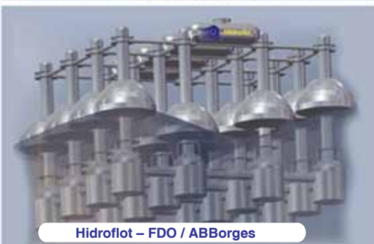
Hidroflot – FDO / ABBorges